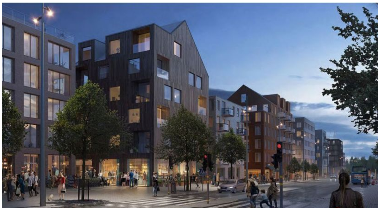
(Ett framtida Salems centrum vid övergångsstället på Säbytorgsvägen.)