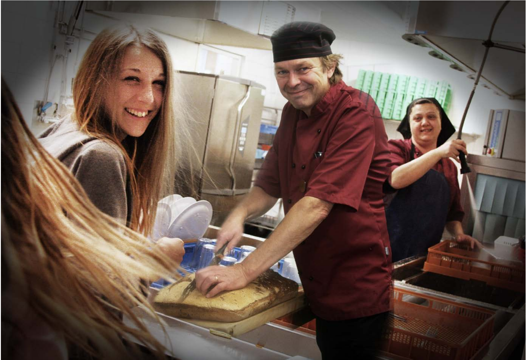
Rönninge skola (fotomontage).

Salems kommun blickar tillbaka på det gångna året