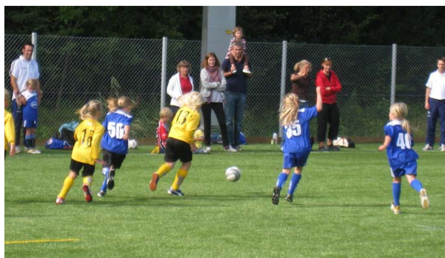
Spel vid Berga bollplan.