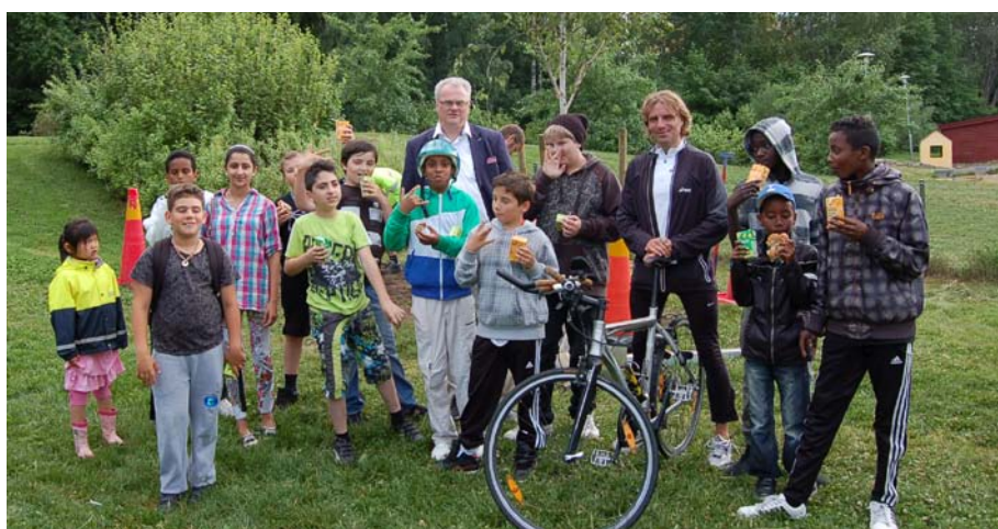
Plantering av Barnens träd i Säbylunden.