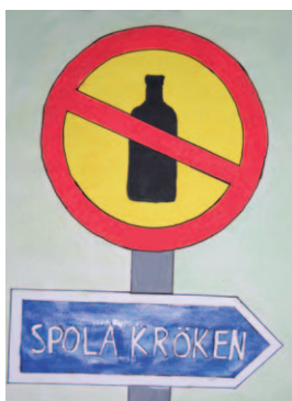
Bild från skoltävlingen mot alkohol i kommunen.

KD anser också att inga skattepengar ska gå till alkohol.