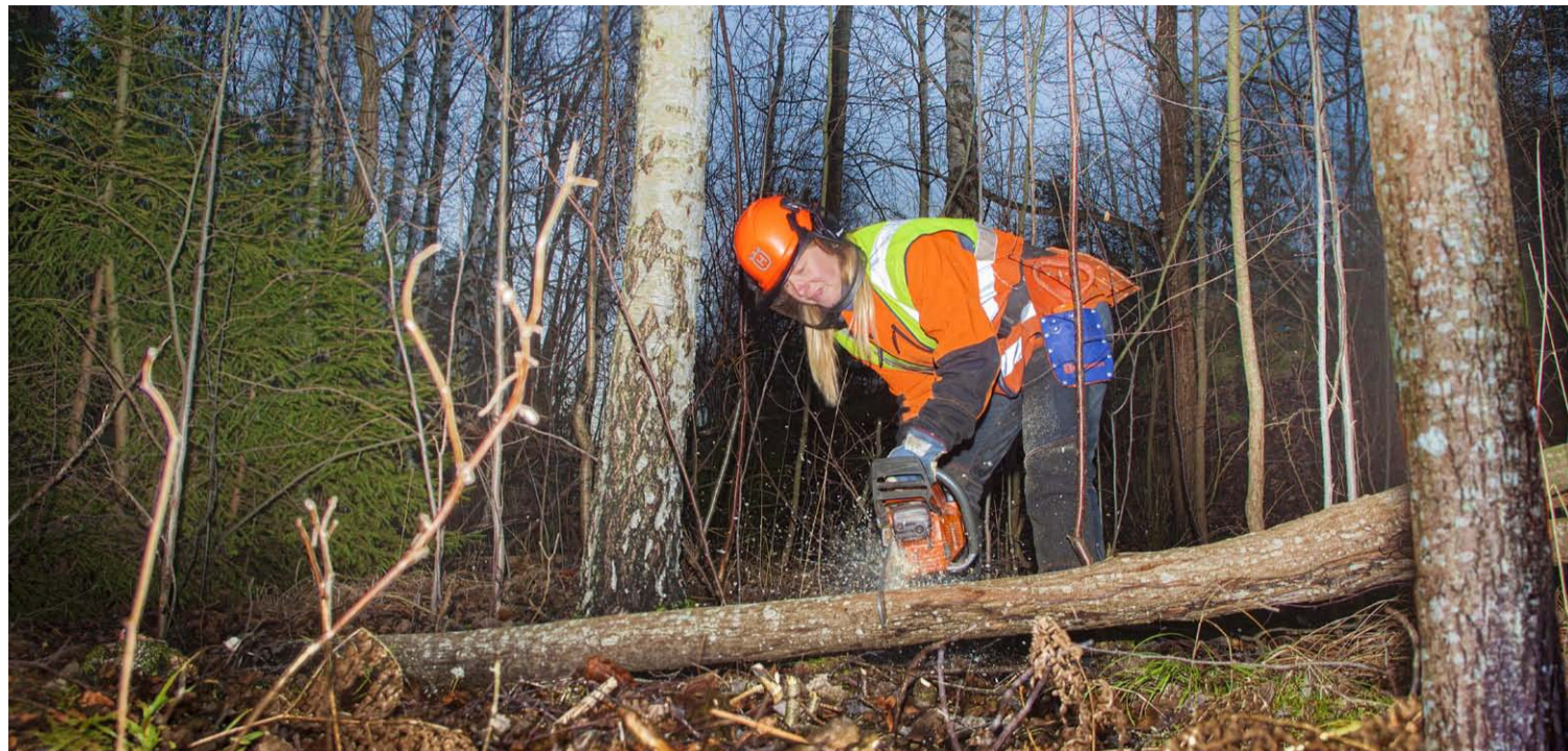
Genom gallringen ska Salem bli mer tillgängligt och tryggare.