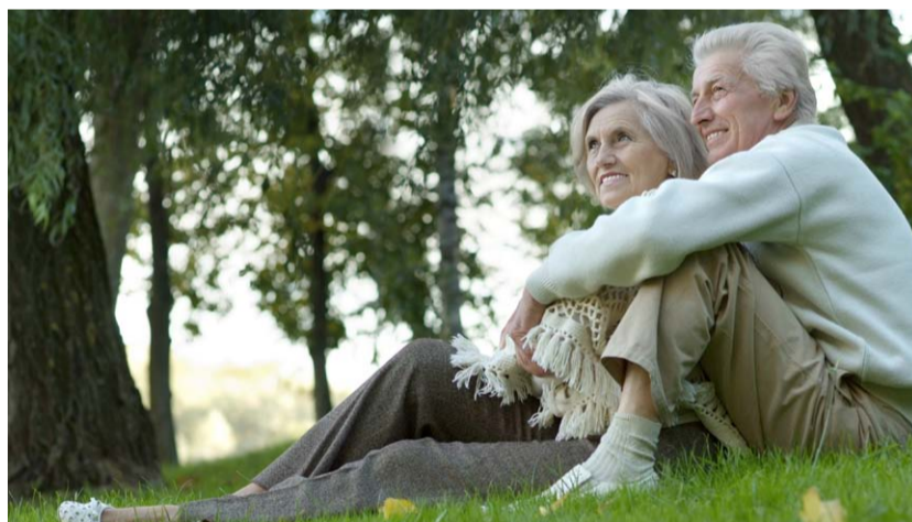
Ett nytt särskilt boende för äldre planeras vid Söderby Park.

Under åren 2014-2016 planeras investeringar på totalt 243 miljoner kronor. Den största posten är 89 miljoner till ett nytt särskilt boende