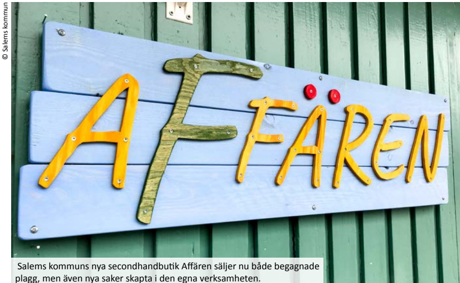
Salems kommuns nya secondhandbutik Affären säljer nu både begagnade plagg, men även nya saker skapta i den egna verksamheten.