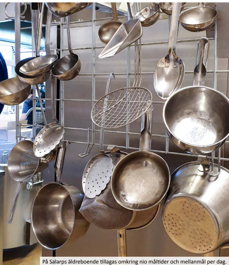
På Salarps äldreboende tillagas omkring nio måltider och mellanmål per dag.