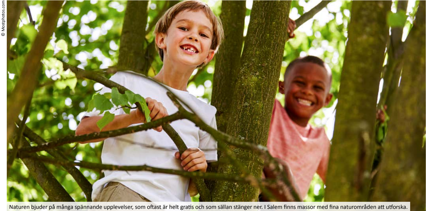
Naturen bjuder på många spännande upplevelser, som oftast är helt gratis och som sällan stänger ner. I Salem finns massor med fina naturområden att utforska.